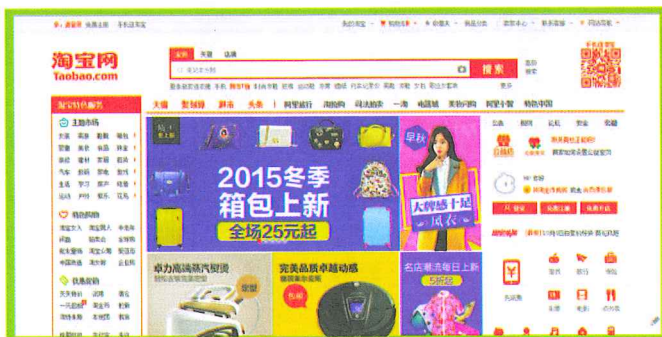
Giao diện trang chủ website Taobao.com

Taobao là website mua hàng trực tuyến lớn nhất Trung Quốc hoạt động với mô hình tương tự như các website eBay hay Amazon.