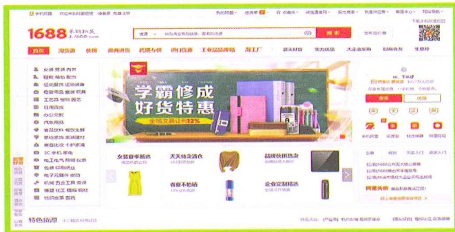
Giao diện trang chủ website 1688.com

sì) các mặt hàng với số lượng lớn. Khi mua với số lượng lớn bạn sẽ được hưởng mức giá ưu đãi, giúp giảm tối đa chi phí và nâng cao lợi nhuận.